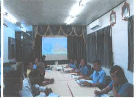
NPCU รพ.สต.เขาทะเล